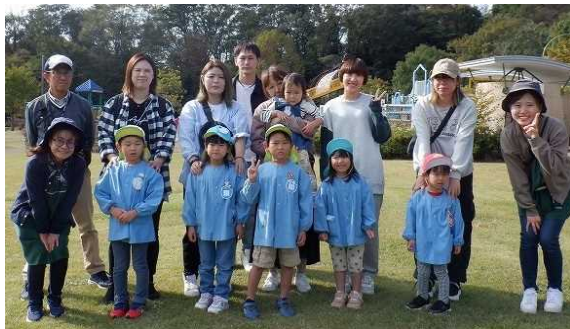
↓縦割り班ごとの記念写真

12月2日には発表会があります。友だちと一緒に歌ったり、リズムカルに体を動かしたり、演技したりすることを楽しめるようにしていきたいと思えます。お子さんが自信をもって舞台上上がるためには、日々の継続と励ましがとても大切です。ご家庭でもご協力をよろしくお願いいたします（体調不良以外ではなるべく休ませないでほしい、という願いも込めています）。