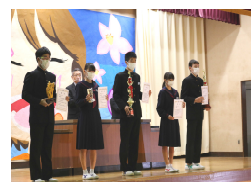
〔合唱コンクール表彰〕