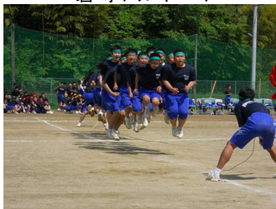
みんなでジャンプ