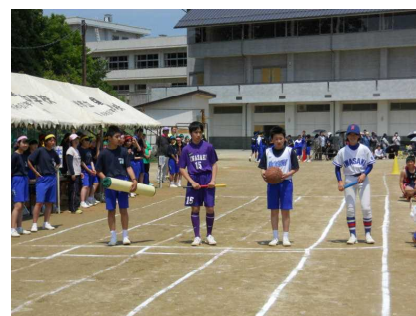
部活動対抗リレー

◇ 県の指定を受け、学力向上推進に取り組み2年目になりました。今年度も磐崎中学校区を単位として、授業スタンダード・学びのスタンダード推進パイロット校として、磐崎小学校、藤原小学校と連携して学力向上を目指します。