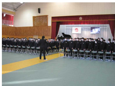
式歌「旅立ちの日に」

中学校3年間、いろいろな思い出ができたことと思います。希望を胸にいただき、旅立つ生徒の門出を祝い、厳粛で感動的な卒業式になることを願っています。(写真は予行前の全体練習)