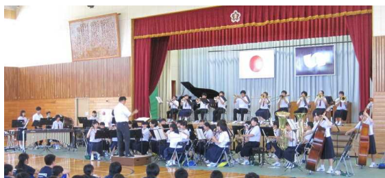
吹奏楽コンクール激励会 (7/7)

※ アリオスではホール内の撮影禁止でしたので校内での発表の様子を掲載します。下の写真は演奏を終えての記念写真です。