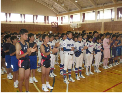
市中体連激励会 (6 / 3)