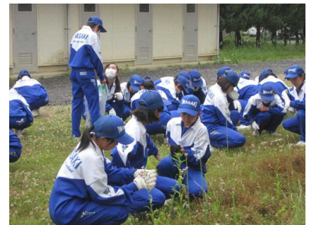
クリーン作戦 (5 / 25)