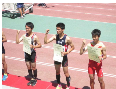
表彰台でガッツポーズ!!