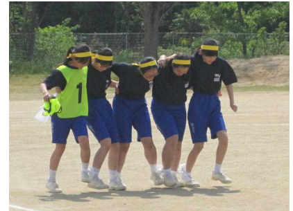
スポーツ大会 (5 / 12)