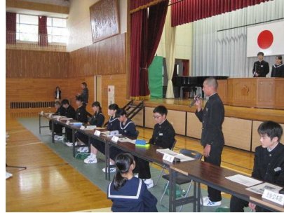
生徒総会 (5 / 10)