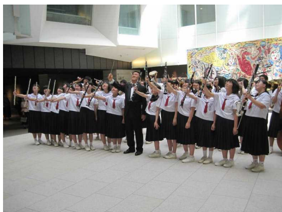
いわき支部大会 (7/15) 銀賞

※ アリオスではホール内の撮影禁止でしたので校内での発表の様子を掲載します。下の写真は演奏を終えての記念写真です。