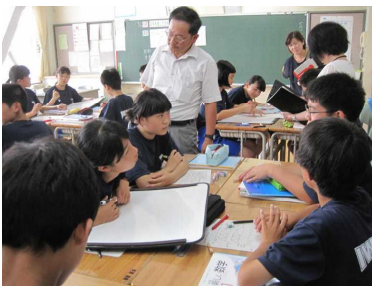
「授業スタンダード」研究授業 (7 / 13)