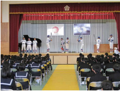
対面式 部活紹介 (4 / 7)