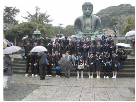
修学旅行 (4 / 11・12・13)