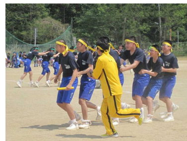
3 年団体種目 磐崎ムカデ競争