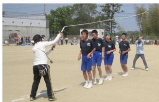
さくら学級 ( 1 位 )