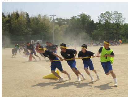
2 年団体種目 磐崎トルネード