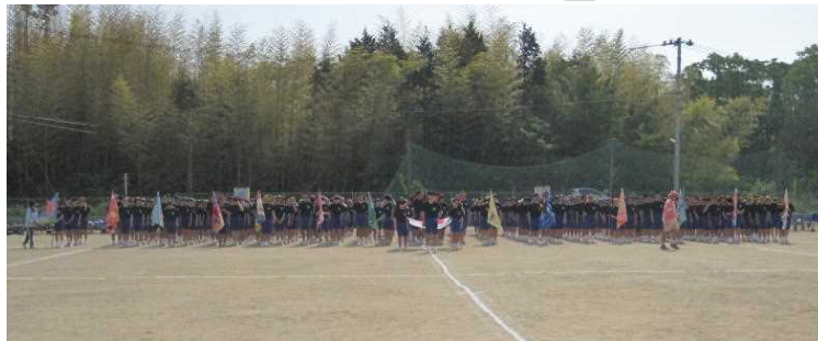
学級旗を先頭に入場行進・開会式

いよいよ6月には中体連となります。子どもたちへの一層のご声援、よろしく願います。