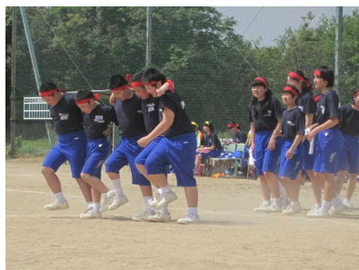
1 年団体種目 磐崎ハウルの走る城