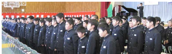
対面式 4 / 7 (金)

今年の入学式も 1 年生のとても元気な立派な返事で、来賓で来られた方々から、おほめの言葉をいただきました。磐中生のよいところは、しっかりあいさつできるところです。伝統を引き継ぐ、とてもよい入学式となりました。