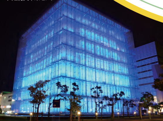
人と防災未来センター