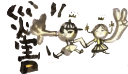
イラスト: 浦嶋 克己さん

お申込み方法 下記に必要事項をご記入の上、事前にFAX、郵送またはEメールにて事務局までお送りください。