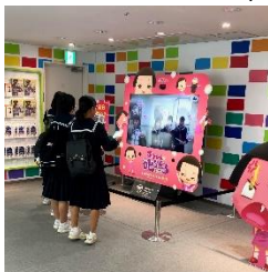
NHKでチョコちゃんに

最終日は東京ディズニーランドでの研修でした。10連休明けと言うこともあり、TDLの混雑は少なく、時間に余裕を持って活動することができました。3日間はあっという間に過ぎていきましたが、一生に残る思い出を刻むことができたと思います。