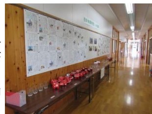
2年生の旅行記と制作物

泊を伴う学校行事は3年生の修学旅行のみです。そのため、中学校最大の行事の1つとなっています。また、だれもが楽しみにしている行事でもあります。それまでに、責任感や協調性、ルールの遵守、公衆道徳・マナーなどをしっかり身に付ける必要があります。それらの力を普段の学校生活を通して身に付けさせていきたいと思います。