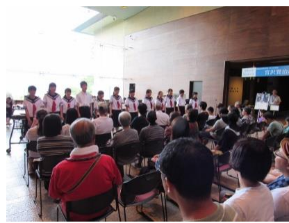
アトリウムコンサートの様子（司会を務めた2年生男子の代表と1年生女子の代表）