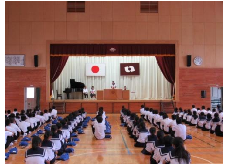
代表生徒による2学期の抱負の発表

今週より2学期が始まりました。夏休み中は大きな事故等もなく、生徒たちが元気よく登校できたことが何よりです。猛暑の夏でしたが、部活動や学夏休みの課題に一生懸命に取り組んでいました。これから82日間の2学期となります。行事等も多く、学級の団結をさらに深めたり、友情を深めたりすることができる時期です。また、学習の成果を上げる時期でもあります。まずは、一回一回の授業を大切にし、継続して家庭学習に取り組むことが基本です。「学問に王道なし」で、地道な努力の中に、すでに結果が含まれています。自分のため、未来のためにがんばりましょう。