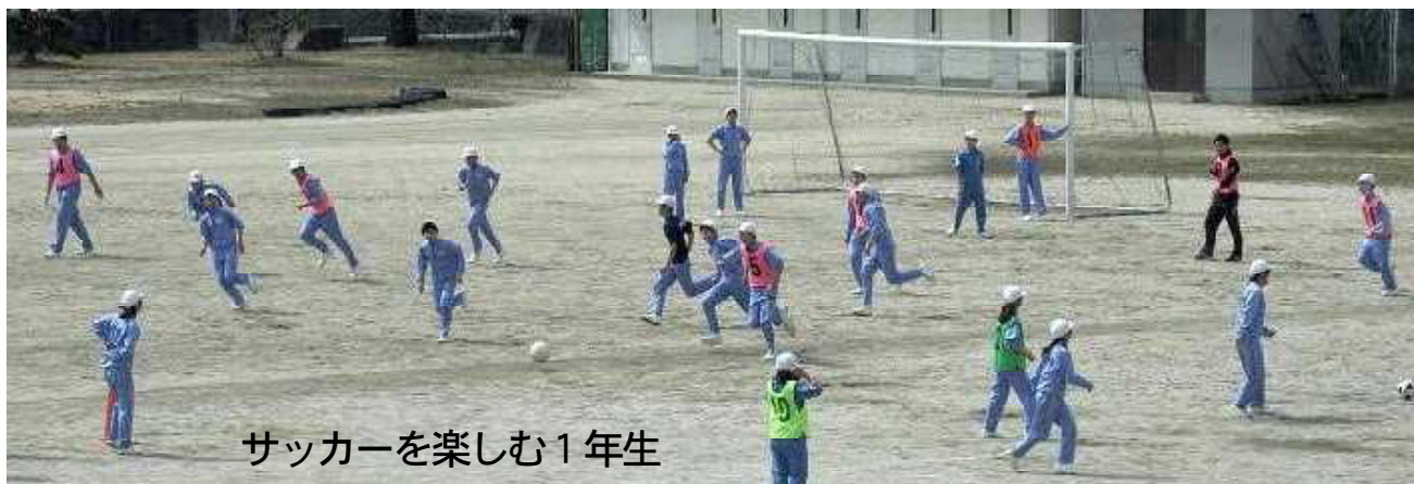
サッカーを楽しむ1年生