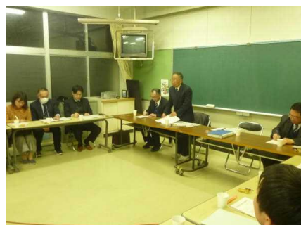
<中学校区小中連携推進会議>