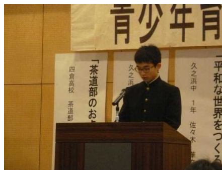
<青少年育成意見発表会>