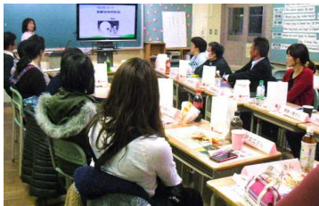
養護教諭による保健事業のお話

今年度も残り1か月余りとなりましたが、先週21日、PTAの「文化部」と「母親委員会」の会合がひらかれました。文化部は、3月に発行予定の新聞「白銀112号」に向けての編集会議です。原稿の校正作業を行いました。