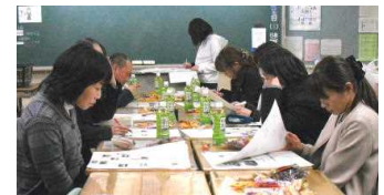
文化部 校正を行っている様子

一方、母親委員会は「懇談会」として、学文化部 校正を行っている様子 校保健委員会も兼ね、今年度の保健室の利用状況や保健関連事業のあらましについて、話し合いを持ちました。始めに養護教諭から、保健室利用から見える本校生徒の特徴、続いて今年度行った「薬物乱用防止教室」、「心肺蘇生法講習会」、「心の教育プログラム」などについてお話をしました。特に、「心の教育プログラム」で用いた自己理解のワークシートの体験では、家庭でも話題にしてみたいとお話が出され、有意義な懇談会となりました。