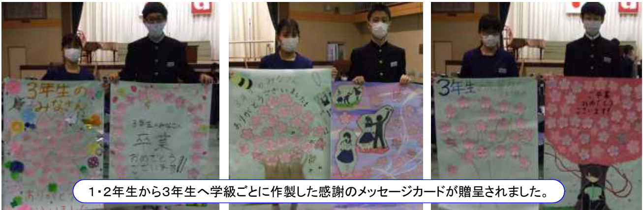
1・2年生から3年生へ学級ごとに作製した感謝のメッセージカードが贈呈されました。

送られる側の3年生代表からも、1・2年生へ学校を託す思いと感謝の言葉が述べられ、会場は一体感と温かい気持ちで満ちあふれていました。