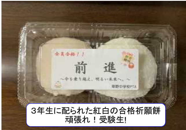
3年生に配られた紅白の合格祈願餅 頑張れ！受験生！

中学1年から3年2学期までの学校生活の様子について全職員で作成する。学習成績、出欠の記録、学級活動や生徒会活動・部活動等の様子、特技や漢検・英検等の取得資格を記載する。