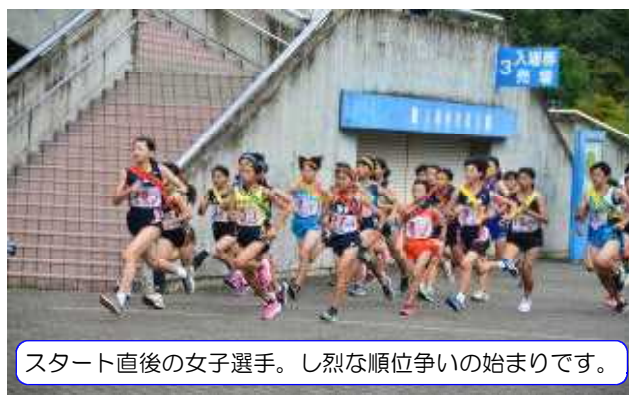
スタート直後の女子選手。し烈な順位争いの始まりです。