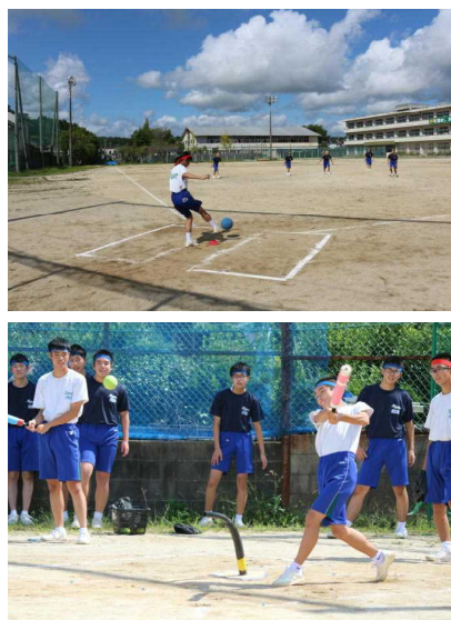
球技大会では、秋晴れのもと好プレーが随所に見られました。額には、大粒の汗が...