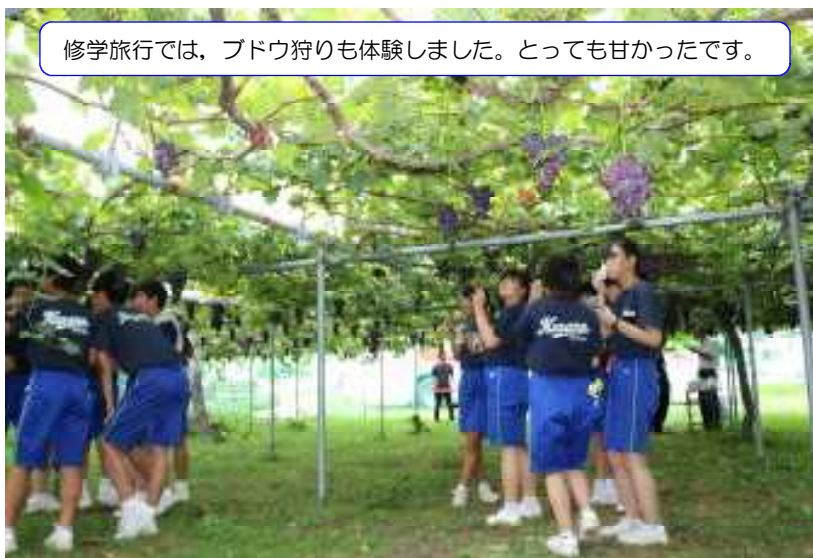
修学旅行では、ブドウ狩りも体験しました。とっても甘かったです。

新型コロナウイルスは、未だ収束には至っていませんので、県内の感染状況を注視するとともに感染症対策を万全にしながら、これらの学校行事を無事に開催できるよう努めて参ります。保護者の皆様のご理解とご協力をお願いします。