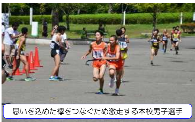
思いを込めた襷をつなぐため激走する本校男子選手

また、その他の部活動は、3年生が区切りを迎え、1・2年生へと代替わりしました。9月下旬から新人大会が目白押しです。自分やチームの強みを十分に伸ばすとともに、弱点や課題を少しでも克服し、成果を上げられるよう励んでほしいと思います。