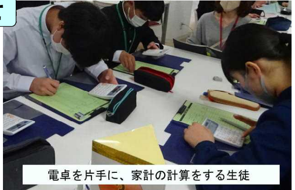
電卓を片手に、家計の計算をする生徒

ボランティアの保護者の皆様、ご協力ありがとうございました。この活動をきっかけに、自分の生き方、進路に夢をもち現実的に考えていくようにして参ります。