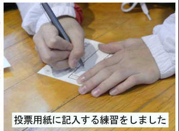
投票用紙に記入する練習をしました

3年生は、あと2、3年すれば、有権者です。未来の有権者として、選挙に関心をもち、よく考えて自分の判断で投票してほしいと思います。