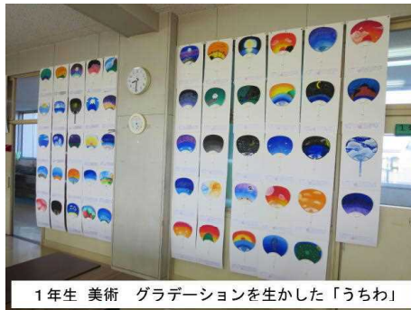
1年生 美術 グラデーションを生かした「うちわ」