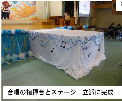
合唱の指揮台とステージ 立派に完成

展示、装飾、会場作りは、生徒1人1人や班活動で制作した作品があり、それらを実行委員が地道な作業を含めて作り上げてきました。おつかれさまでした。