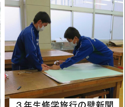
3年生修学旅行の壁新聞を補強する実行委員