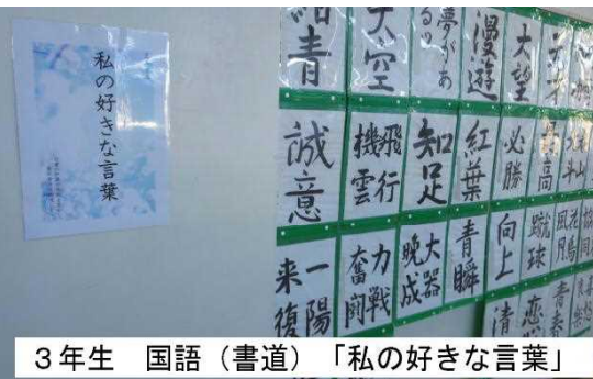
3年生 国語(書道)「私の好きな言葉」