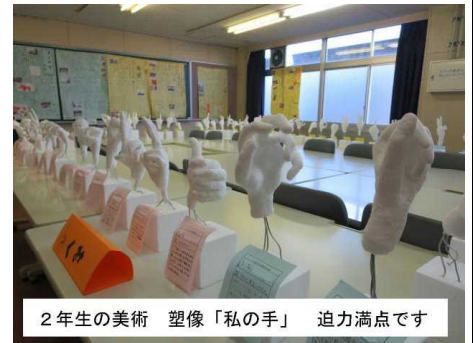
2年生の美術 塑像「私の手」 迫力満点です