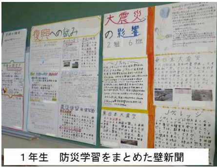
1年生 防災学習をまとめた壁新聞

草中祭は文化的行事ですので、生徒の日頃の学習の成果を紹介しました。今年度は、生徒作品を体育館ではなく、1階の特別教室に学年ごとに展示。これまでよりも生徒も保護者もしっかり参観する時間と場所を確保するよう努めました。保護者の皆様には、合唱の前後にご覧いただき、ありがとうございました。展示の一部を紹介します。