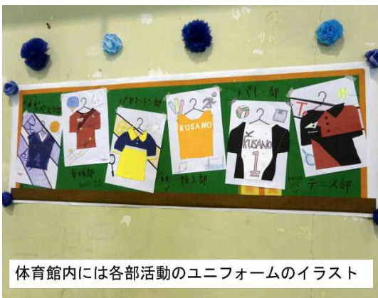
体育館内には各部活動のユニフォームのイラスト