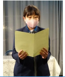
5年生代表：感謝の言葉

まず、放送室からTV放送で、全体会をしました。 5年代表の挨拶の中では、今まで、委員会やクラブ活動、集会活動など、様々な学校生活の中でお世話に