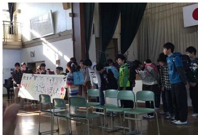
6の3の劇フィナーレの場面

さて、学校の教育活動に対して要望や意見があったものについて、今回も3つだけですが、取り上げたいと思います。