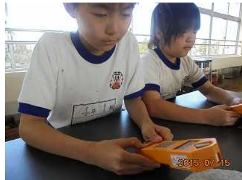
② 物品購入費 ○4学年：放射線の遮へい実験の授業の授業(27.7.15)