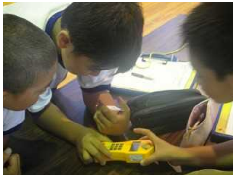
① 物品購入費 ○5学年：放射線教育の授業(27.7.15)