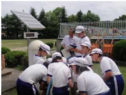
③ 物品購入費 (27.7.15) ○6学年：校地内の放射線の測定