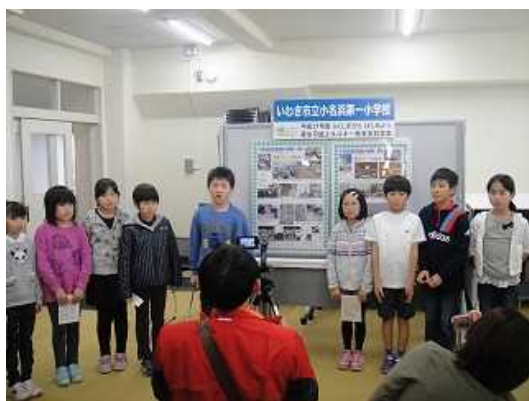
⑮ 車両借上料 ○4 学年：見学・体験学習の成果発表会 (いわき明星大学) (27. 11. 28)