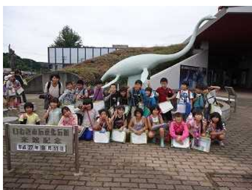
⑨ 車両借上料 ○ 3 学年：ほるる（いわき石炭化石館）の見学 (27. 9. 11)