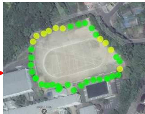
④ 消耗什器備品費 校地内の放射線を測定した結果