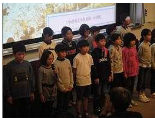
⑯ 車両借上料 ○5 学年：エネルギー施設見学・体験 学習の成果発表会 (いわき明星大学) (27. 11. 28)