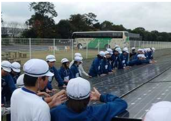
⑪ 車両借上料 ○5 学年：太陽光発電の見学 (27. 9. 11)