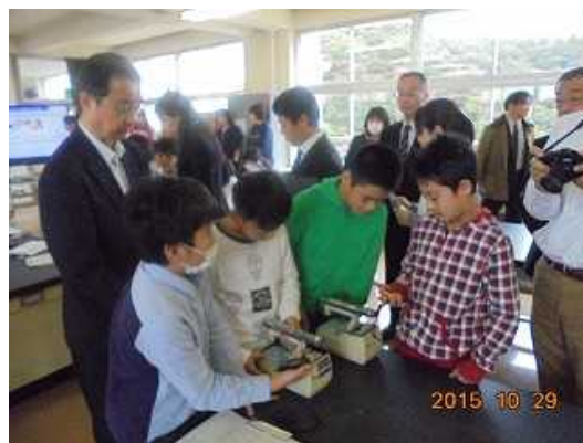
⑭ 物品購入費・消耗什器備品費 ○6 学年：放射線教育授業公開 (27. 10. 29)