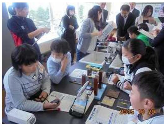
⑬ 物品購入費・消耗什器備品費 ○6 学年：放射線教育授業公開(27. 10. 29) ・いわき市内の小・中学校の先生方60名参加