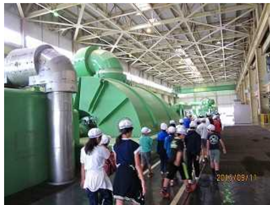
⑫ 車両借上料 ○6 学年：常磐勿来火力発電所の 見学(27. 9. 11)