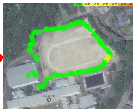
⑥ 消耗什器備品費 放射線測定結果の変化 ● : 0. 01~0. 10 \mu Sv/h ● : 0. 10~0. 20 \mu Sv/h