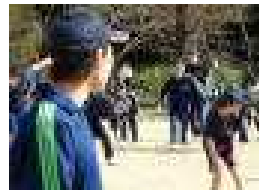
【だるまさんの一日】

小中学生だけでなく応援に来ていたご家族の方や教職員も一緒に楽しんで楽しみました。