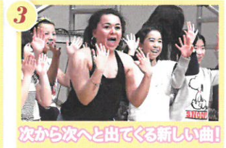
3 次から次へと出てくる新しい曲!