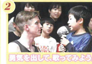
2 勇気を出して、歌ってみよう。