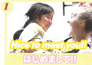
Nice to meet you!! はじめまして!!