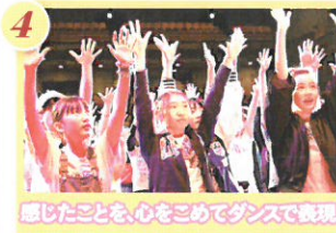
4 感じたことを、心をこめてダンスで表現。