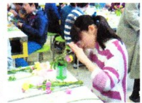
6年生のために心を込めて!

元気いっぱい男子も真剣にアレンジメントしていました。なかなかいいセンスのアレンジメントができました。千日紅の会の皆さんありがとうございました。