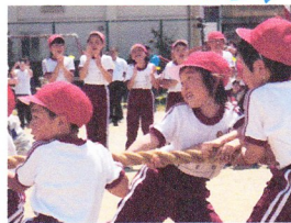
全校生で よしまっ子力くらべ

5月17日、一日順延して、青空の下、運動会が行われました。「走り出せ ゴールめざして一直線」のスローガンのとおり、一人一人がいのちが輝く演技の連続でした。