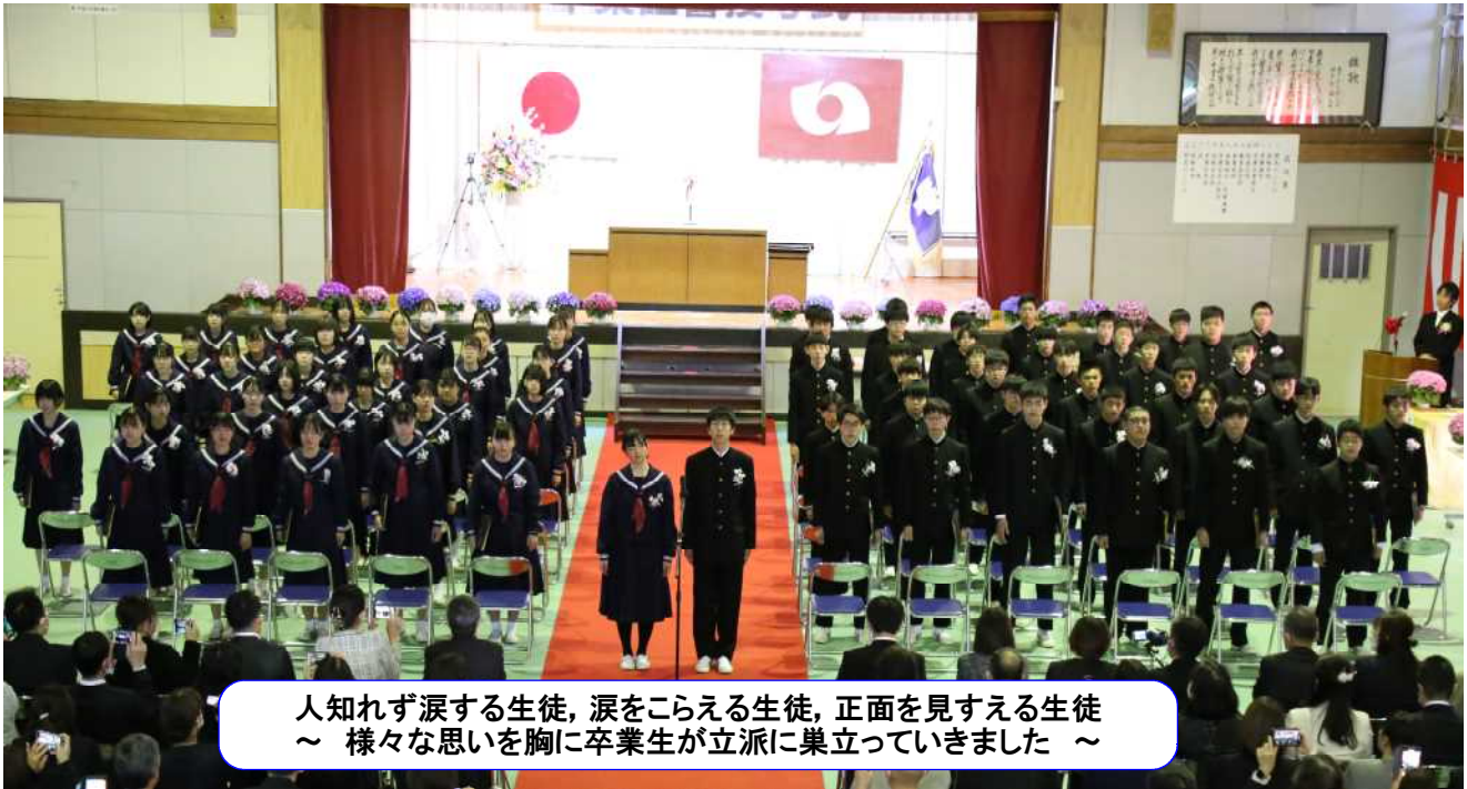
人知れず涙する生徒、涙をこらえる生徒、正面を見ずえる生徒 ～ 様々な思いを胸に卒業生が立派に巣立っていきました ～