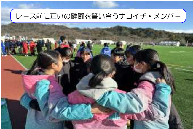
レース前に互いの健闘を誓い合うナコイチ・メンバー