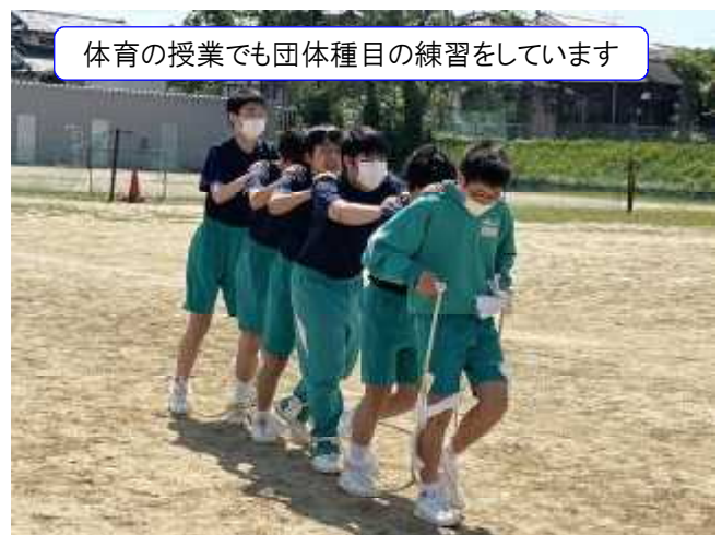
体育の授業でも団体種目の練習をしています