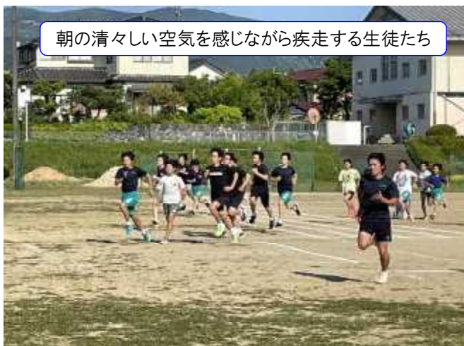
朝の清々しい空気を感じながら疾走する生徒たち