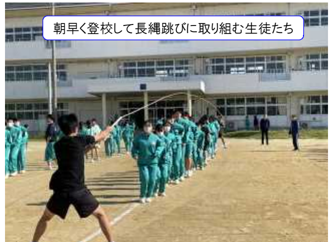
朝早く登校して長縄跳びに取り組む生徒たち

うかと思しますので、周囲との距離が十分にとれない場合はマスクの着用もご配慮願います。新型コロナウイルス感染症は第5類に移行されましたが、いまだ収束には至っておりませんので、安全・安心な体育祭の実施に向けてご協力ください。各種目の予定開始時刻は過日プリントでお知らせしておりますが、進行状況が前後する場合がありますので予めご了承ください。また、当日は給食がありませんので、忘れずに弁当を持たせてください。