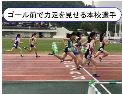
ゴール前で力走を見せる本校選手

6月24日(金)には県大会に出場する選手の激 励会を開催し、全校生徒で気持ちを込めた応援を 繰り広げました。選手の皆さんには、いわき市の代表 として更なる高みを目指してほしいと思います。また、 県大会への出場はかなわなかったものの力の限りを 尽くして競技した選手の頑張り心に心から拍手を送りま す。さらに、子供たちを様々な面から支えていただい た保護者の皆さんに厚く感謝申し上げます。多感な 中学生の時期に、同じ部に集い、多くの時間を共に して得ることができた様々な経験は、生涯の宝となる ことでしょう。