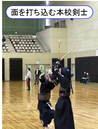
面を打ち込む本校剣士