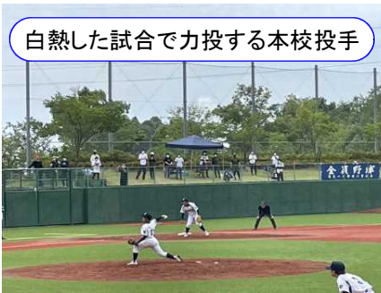
白熱した試合で力投する本校投手