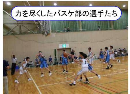
力を尽くしたバスケ部の選手たち