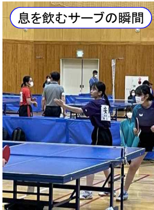
息を飲むサーブの瞬間