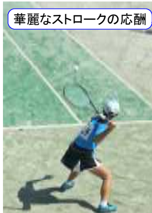
華麗なストロークの応酬