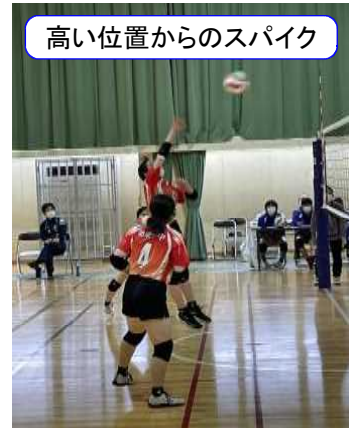
高い位置からのスパイク