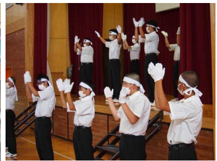
<応援団による応援①>