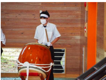
<応援団による応援②>