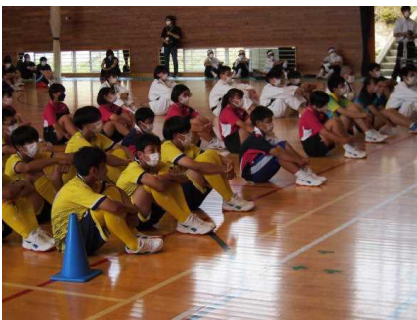
<県中体連大会出場選手たち>

7月11日(月)6校時に生徒会主催で県中体連及び吹奏楽部の吹奏楽コンクール支部大会の壮行会が行われました。市大会を勝ち抜いたチーム、選手の皆さんは、学校の代表・いわき市の代表として、練習の成果を十分に発揮して東北大会の出場を勝ち取ってほしいです。市大会より厳しい戦いが予想されますが、今まで厳しい練習に耐えてきたことをばねに換え、仲間を信じて戦ってきてください。吹奏楽部は、県大会を目指して頑張っているとの思いで精一杯応援しました。