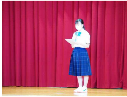
<生徒会役員より激励の言葉>