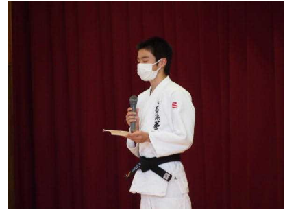
<生徒代表お礼のことば>