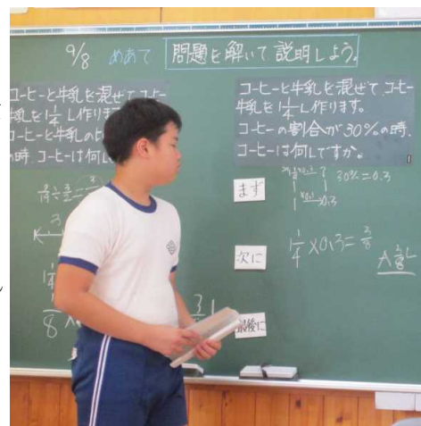
【自分の解決方法を説明する児童】

9月8日には、6年生の提案授業を通して、学ぶ子どもの姿を校内で共有のものとしました。