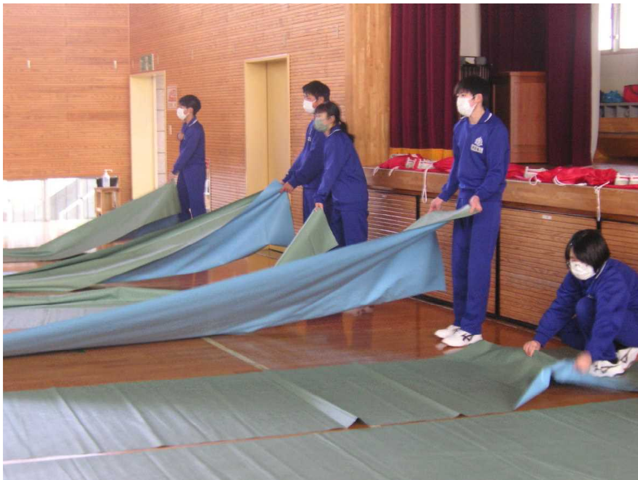
後輩が卒業式練習会場を準備してくれました。(2月28日 昼休み)