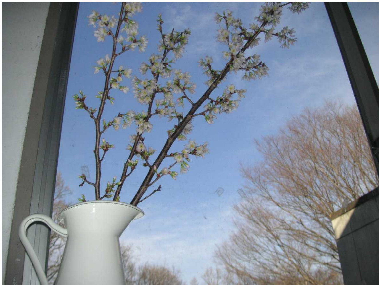
「サクラ咲く」—— 早咲きのサクラが飾られています。(3月1日 3年廊下)

いよいよ明日は県立前期選抜入試ですね。 中学校でこれまで学び得た学習や生活、部活動などの力をいかに発揮してください。