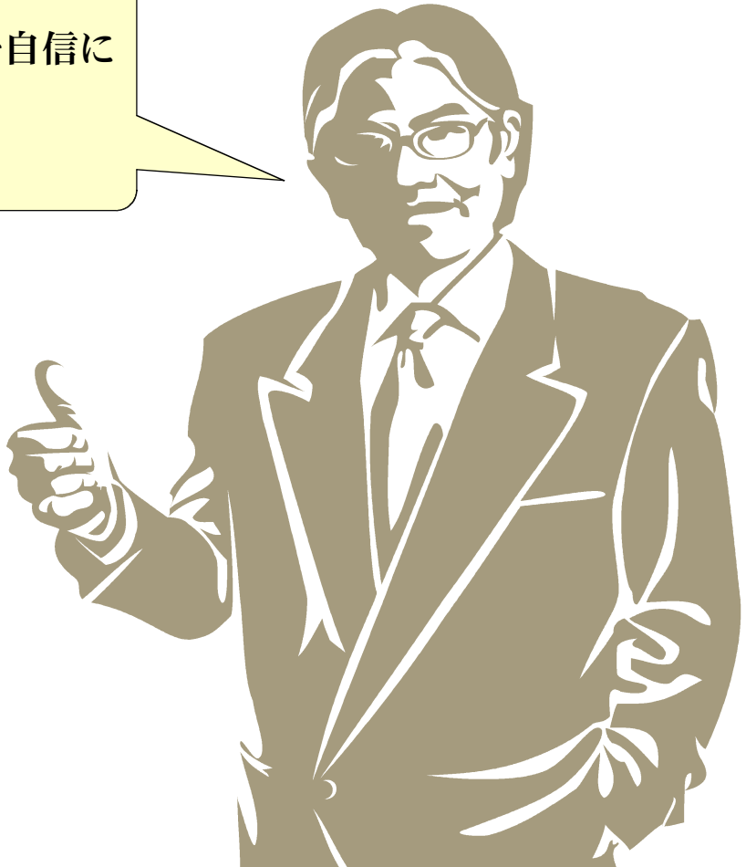
全院 合格 先生