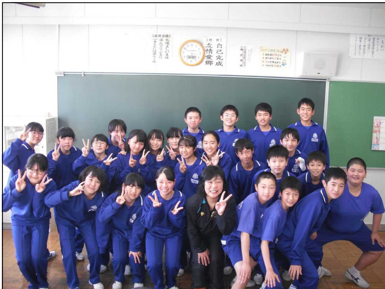
2年前はこんなに〇〇でした。(旧1年2組)

「この3年でこんなに成長していたのか。」 当たり前のことですが、改めて実感させられた ことがありました。 先日の卒業式練習の時です。1時間半に渡る 式の中で、生徒がマスクを外す場面が一度だけ あります。担任教師の呼名を受け校長先生から 証書を授与されるわずかな時間です。 その日行われた初めての証書授与の練習で も、ポケットにしまう手順などを確認するため、 生徒たちはマスクを外し階段をゆっくり上がっ てきます。壇上から見える引き締まった顔。顔。