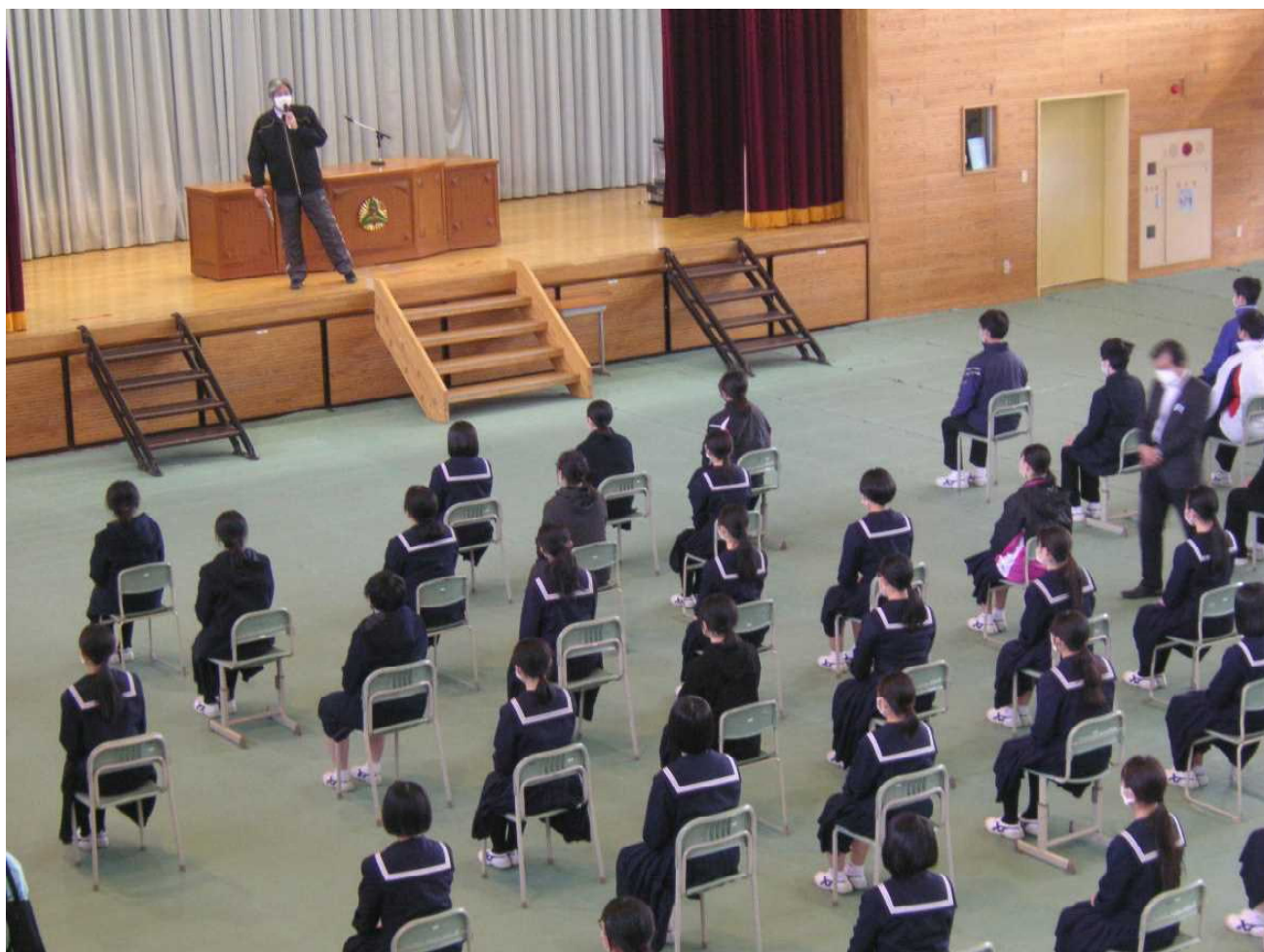
式進行役の先生の話真剣に聞く3年生 — 卒業式の練習が始まりました。(2月21日)