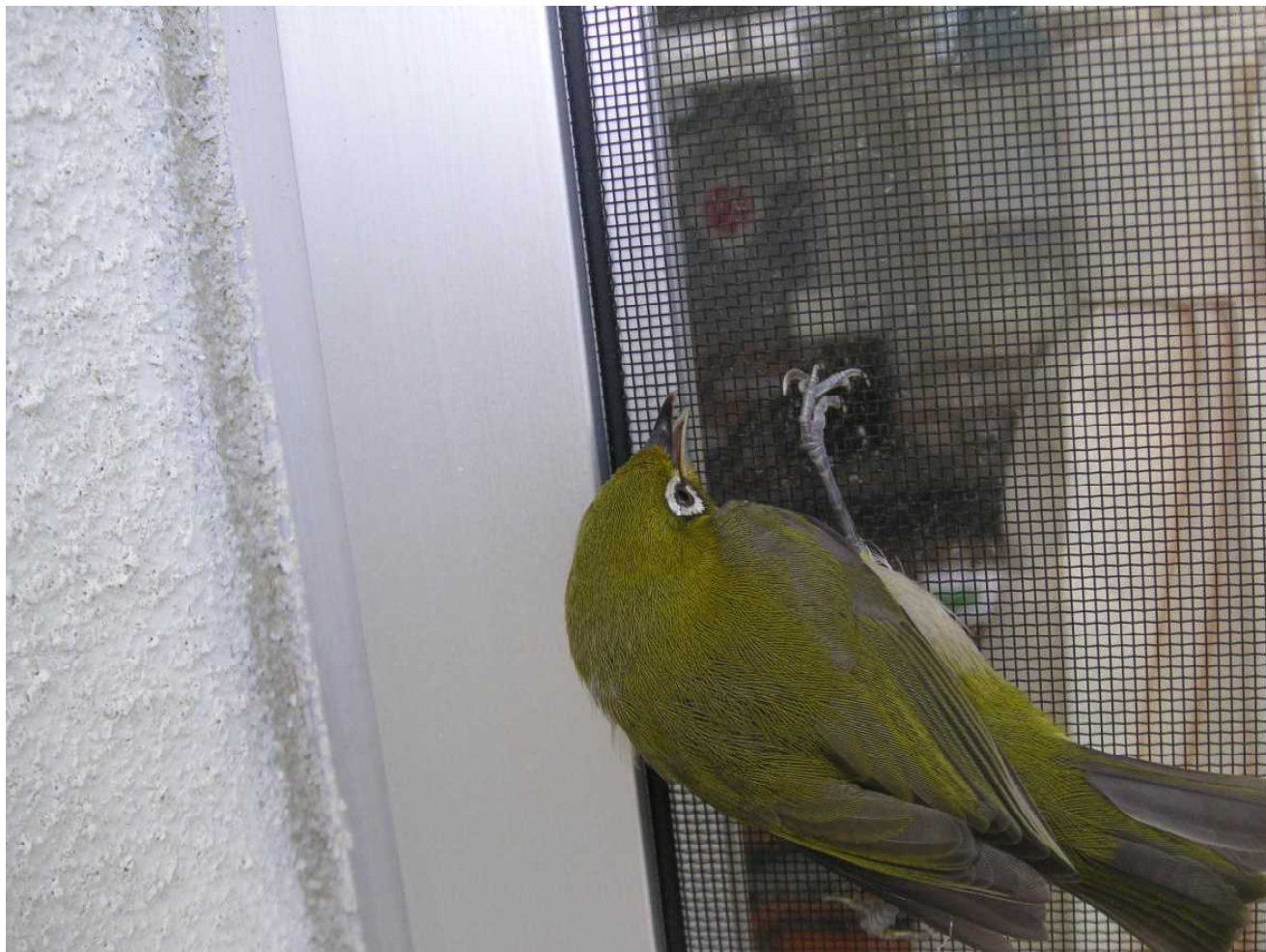
美術室の網戸にメジロ出現!! (撮影日時 不詳)

先日、学年通信用に撮りためた写真データを整理しました。学年行事などで活用したいという話があったためです。