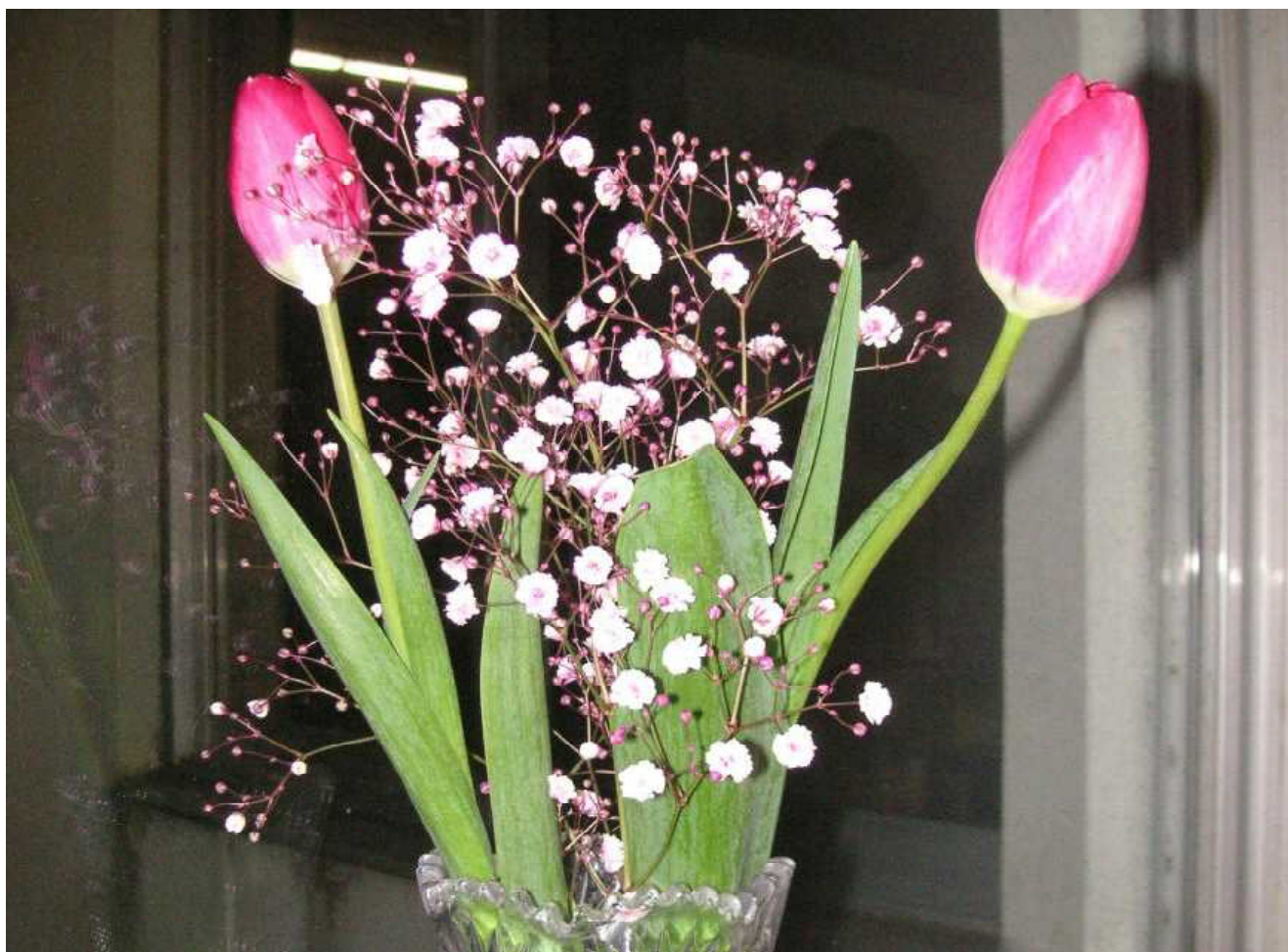
春の知らせはそこまで — 流しに置かれたチューリップ (2月4日)

「せき、鼻水、倦怠感」— 新型コロナに感染したときの症状の一部です。やっかいなのは、花粉症で現れる症状も同じだということです。