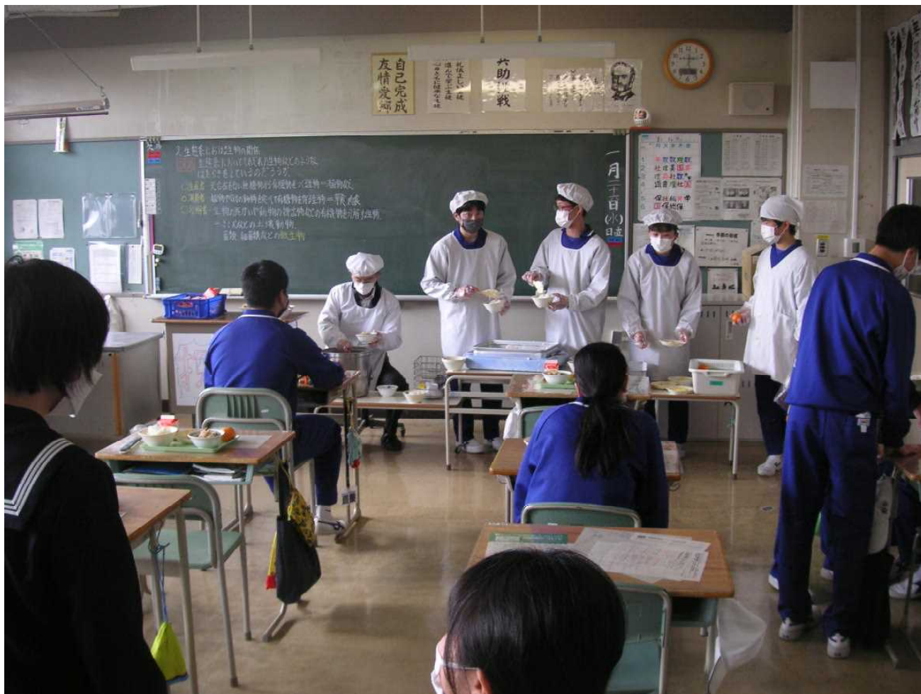
分かりますか。エプロンを着けた人の中に先生がいます。(1月26日 3の1 給食の時間)