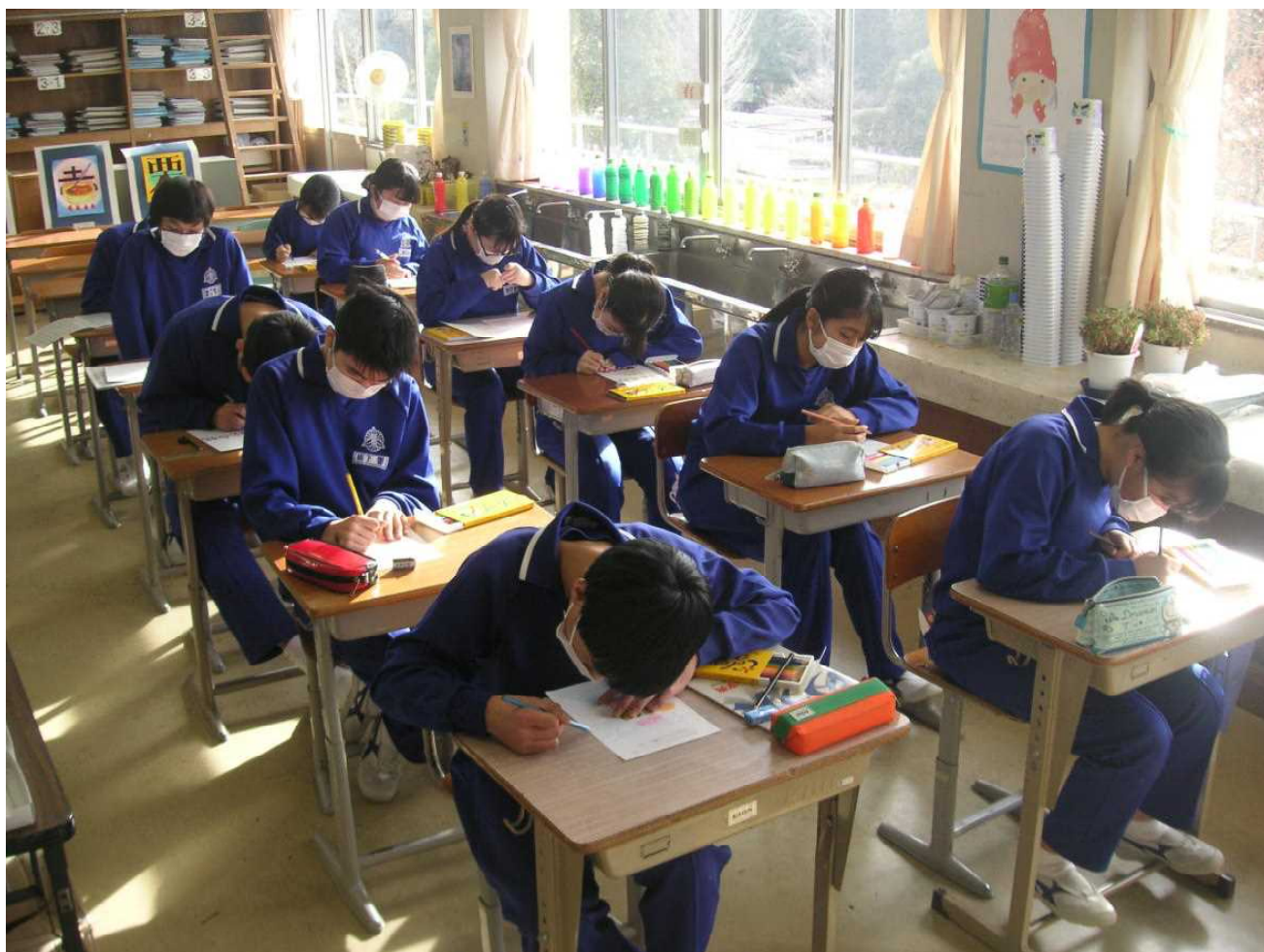
美術の授業では「私への年賀状」を制作し、がんばる自分へエールを送ります。(1月12日 3の1)

休み時間に3年生のフロアを通りました。大声で話す生徒もなく、次の授業準備に取り組んでいます。中には、誰もいないのかなと思うほど静かなクラスも。