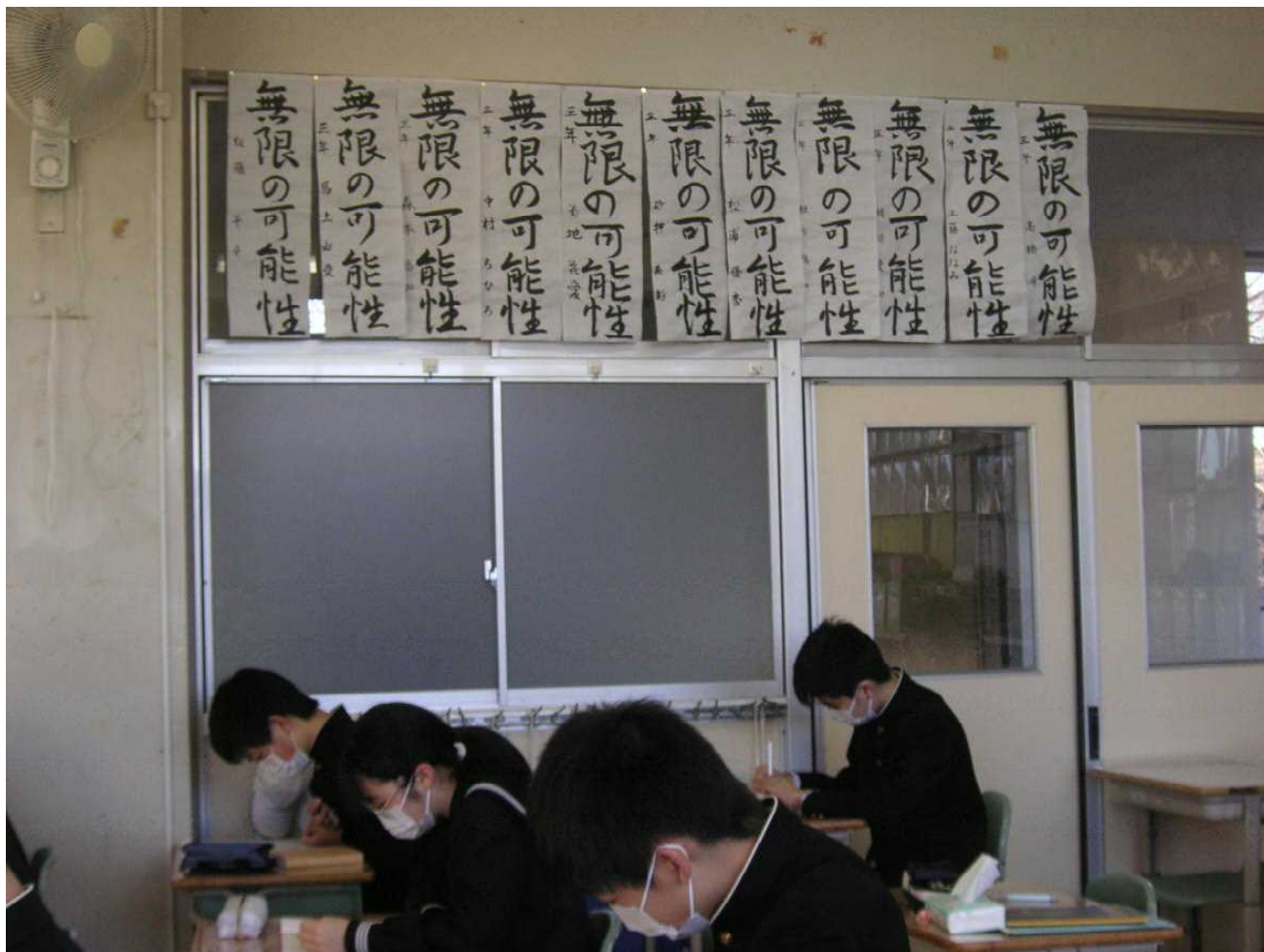
書きぞめが貼り出された教室で、朝の自主学習に取り組みます。(1月19日 3の1)

毎回、「これで最後にしたい」と願いながらつけてきた学年通信の「命を守る」——この見出しを本号でも使わざるをえません。