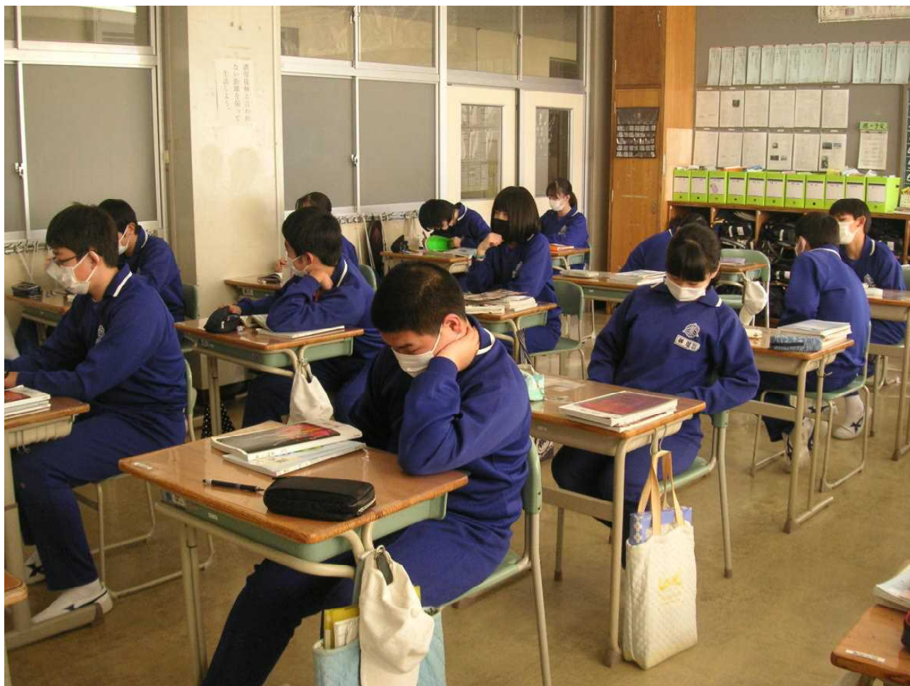
6校時開始に向け、授業の準備をしたり、体を休めたり…。(12月16日 3の2)