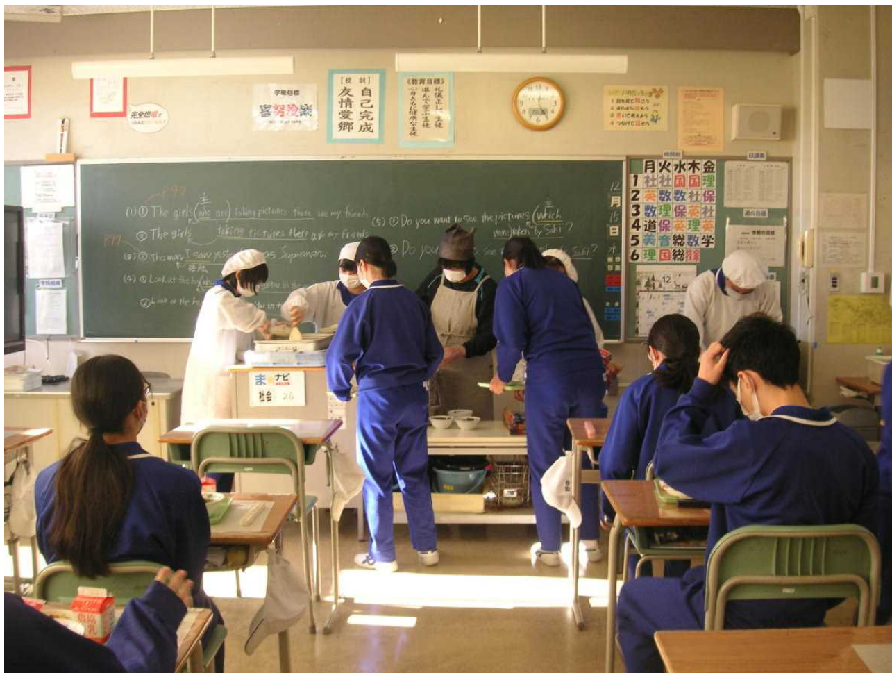
配膳の際も、密を避けるため、列ごとに受け取ります。(12月15日 3の3 給食の時間)

学級と同じように教師にも日番があり、校舎の戸締まりや火気の確認を行います。昨日は私が当番でした。「今日はめずらしく3階トイレの窓が開いている…」眼と手で確認しながら1時間ほどかけて教室や廊下を回ります。