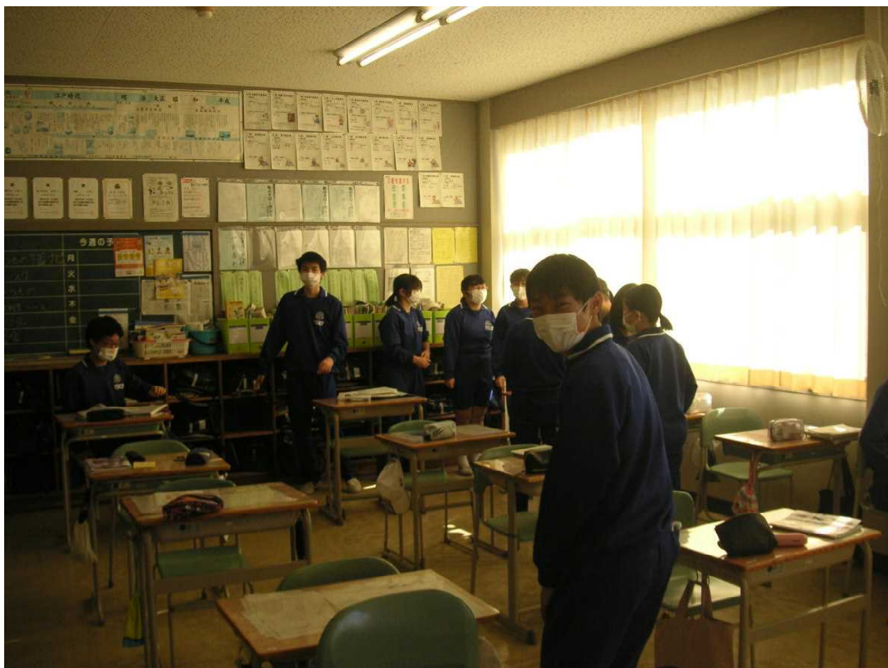
友だちとの短い会話も楽しい休み時間です。(12月13日 3の1)