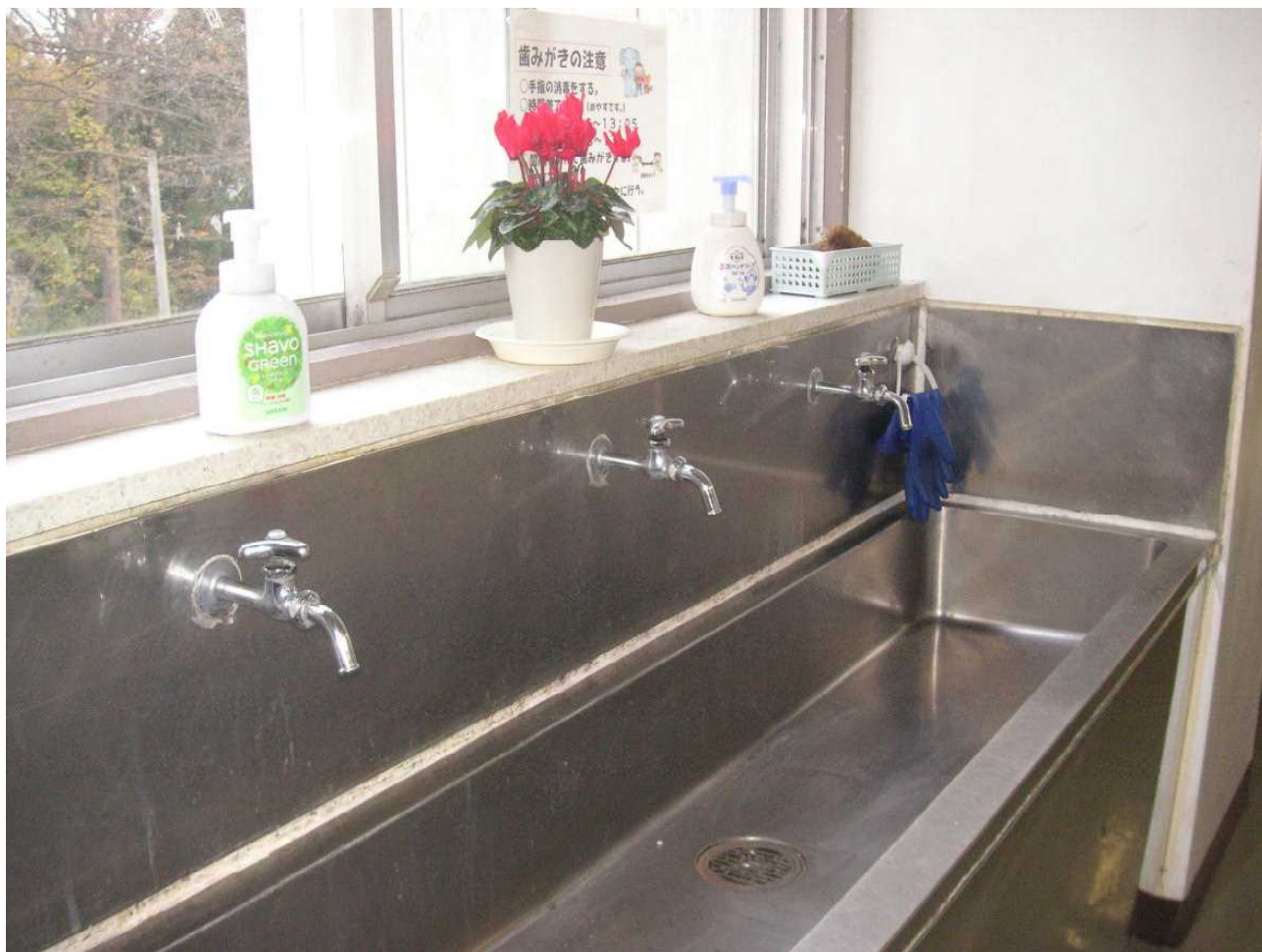
3年生前の流し — きれいに掃除され、季節の花が飾られています。(12月6日 朝)