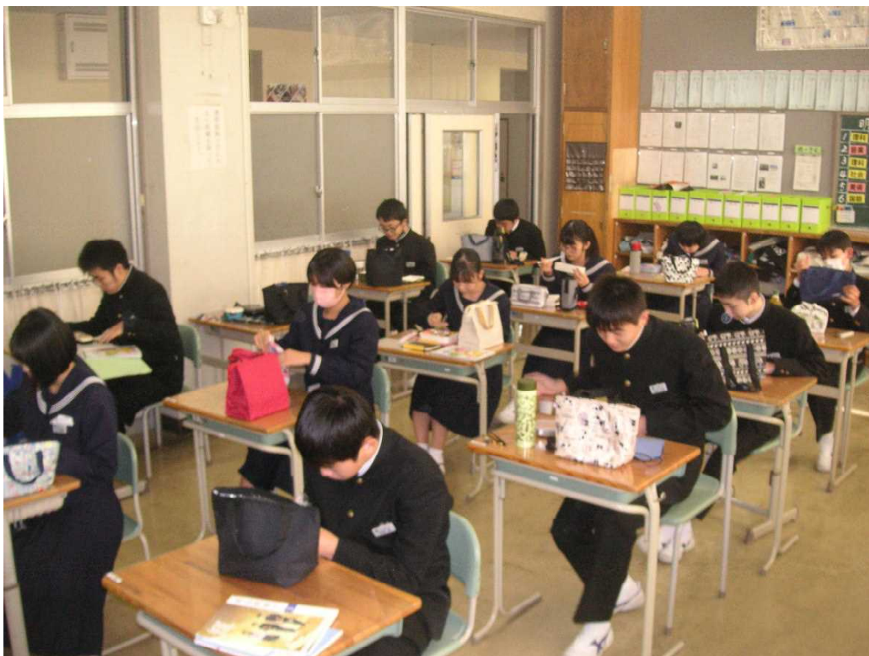
つくってくれた人に感謝 — 今日はお弁当の日 (11月18日 3の2)

来週の金曜日(11/26)もお弁当になります。この日は「親子ふれあい弁当デー」とし、親任せのお弁当づくりから、食育の一環として生徒もできることをやろうと呼びかけているものです。