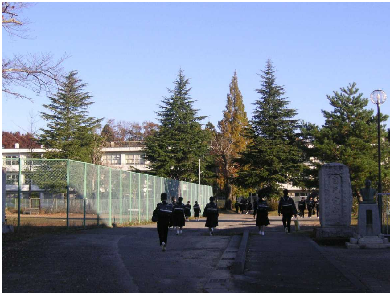
晩秋の朝 — 陽光の中、校舎に向かう生徒たち。(11月15日)

先週末、家族の健康診断のため地域の病院に行きました。待合室にいと、さまざまな患者さんが受付を経て診察室に向かっています。