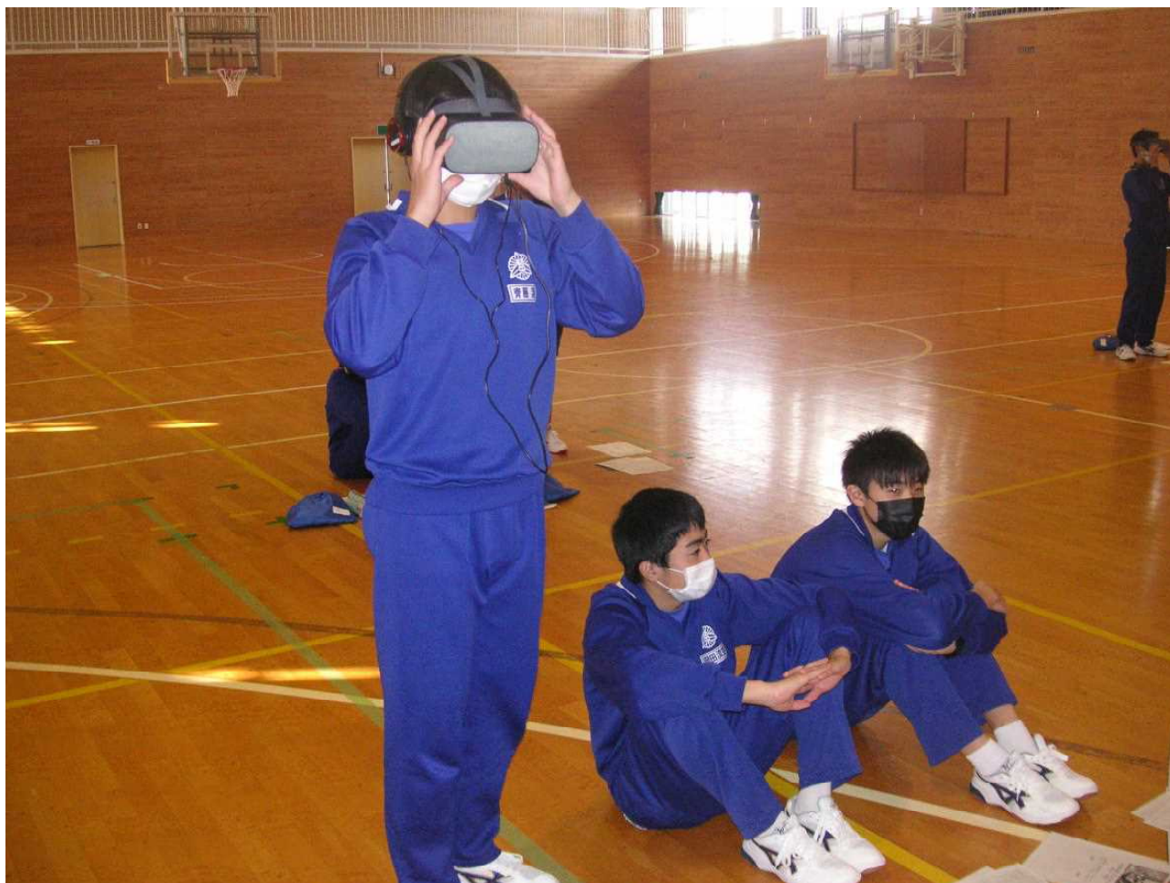
ゴーグルをつけ、VRで認知症の疑似体験をします。(11月10日 総合的な学習の時間)