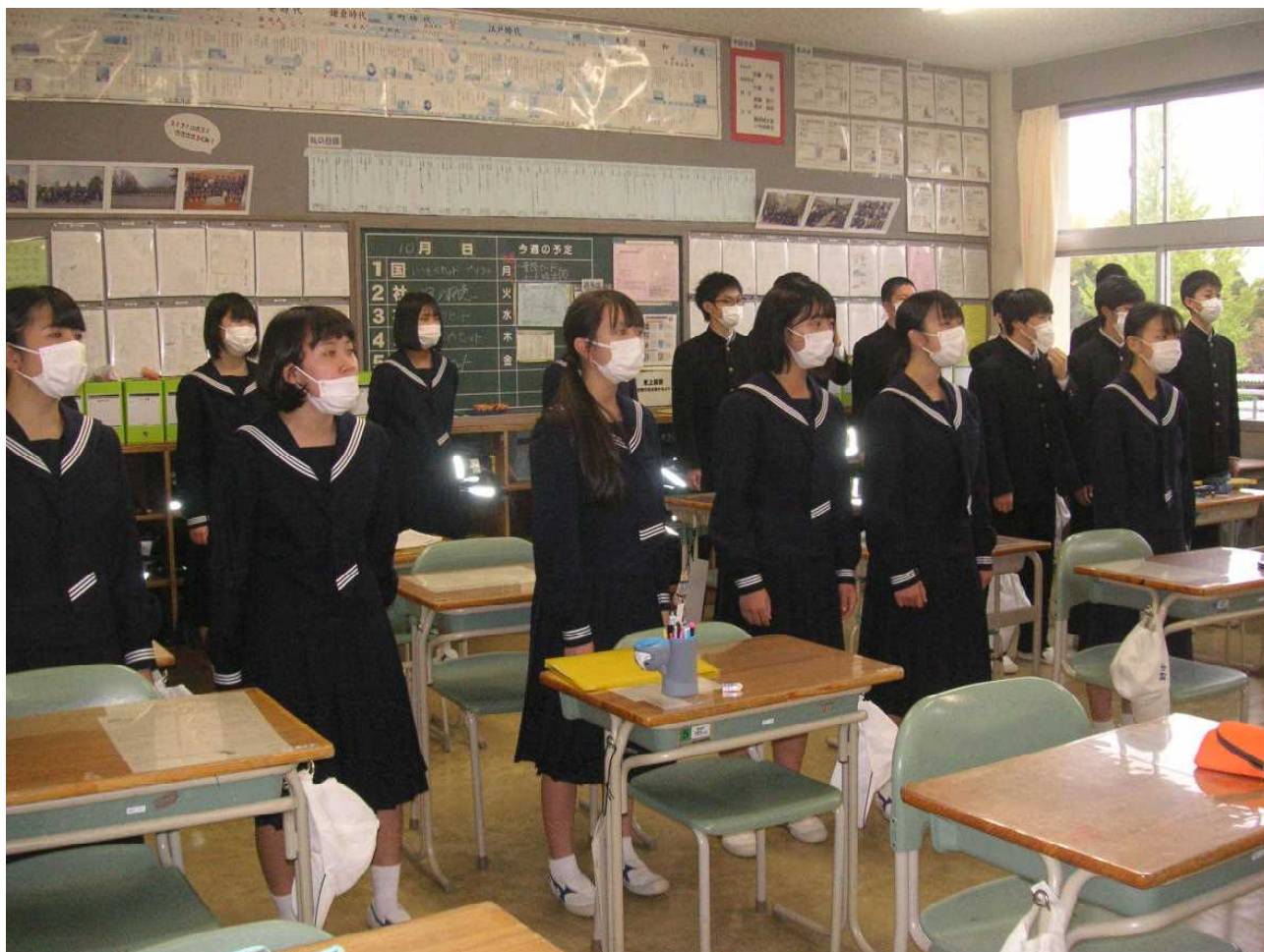
合唱練習 — 全員で合わせ、歌の仕上げに入っていきます。(10月27日 3の3)