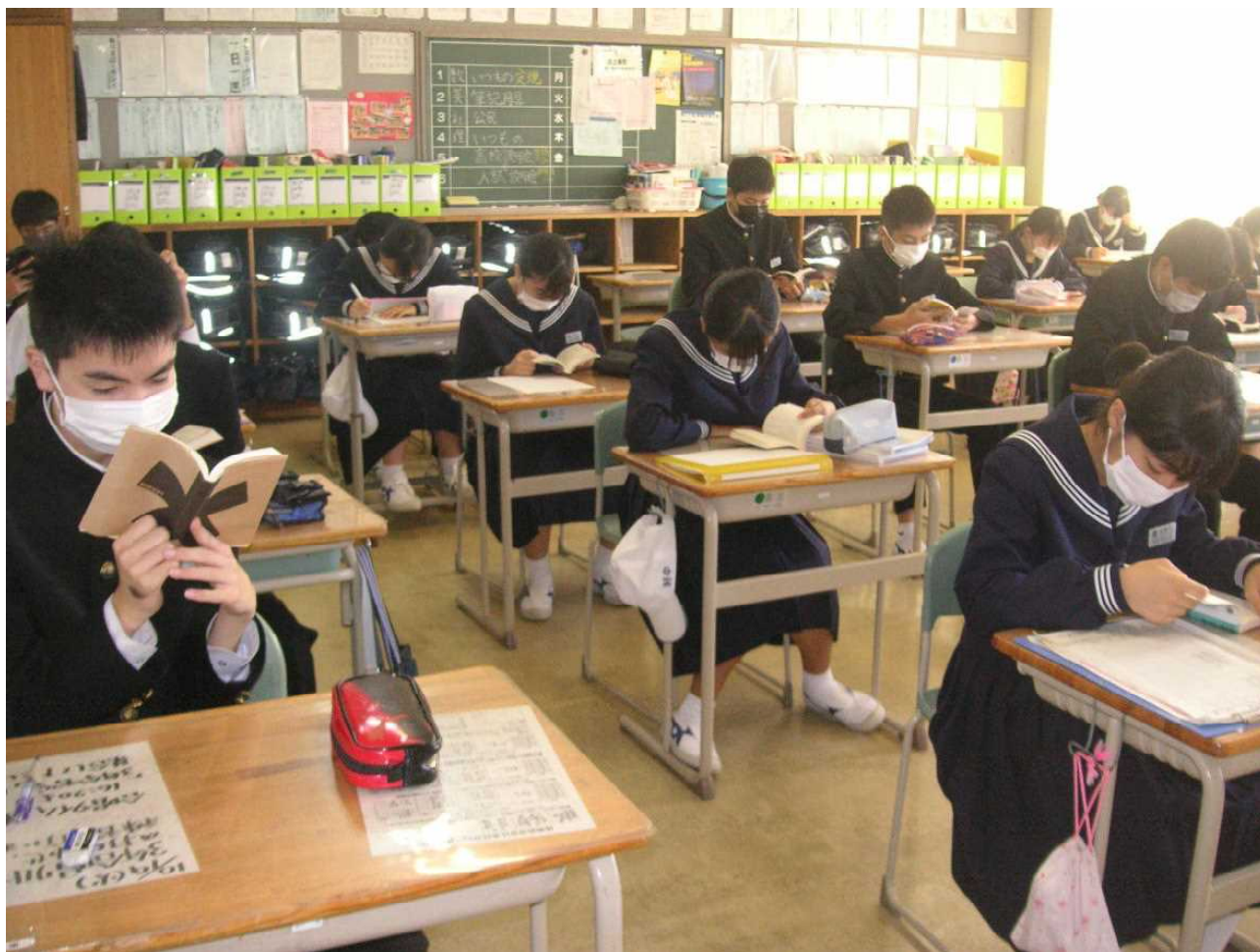
今日は高校説明会。新たな気持ちで一日をスタートさせます。(10月20日 朝の読書 3の1)