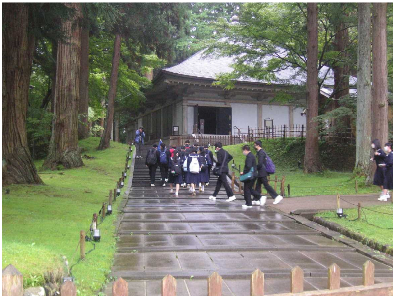
雨上がりの石畳を中尊寺の金色堂に向かいます。(修学旅行1日目 10月12日)

天候に恵まれた修学旅行でした。初日午前 の福島市を除き、どの見学地でも傘をさす心配は なく、それぞれの目的地を巡ることができまし た。最終日は朝から澄みわたる青空が広がりまし た。秋の輝く日差しの中、生徒達の歓声が山 形の地に響いていました。